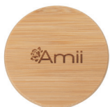
mit AMII Logo