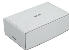
individuell gebrandete Geschenkbox

Lasergravur auf dem Kerzenglas ist auf Anfrage möglich.