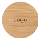
mit individuellem Logo